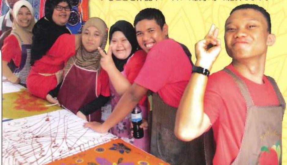
ケダ州にあるリハビリテーションセンター・ムルボックの楽しい仲間とバティック工房にて

申込み先 (公財)兵庫県国際交流協会 TEL. 078-230-3262 (月~金 9:00~17:30)