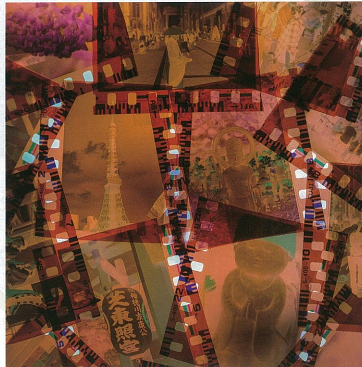
Grand Prize : Attila Erdos / Hungary