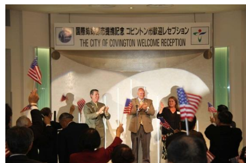
コビントン市関係者の来日を歓迎

※詳細についてのお問い合わせは (公財)兵庫県国際交流協会 企画広報課 TEL 078-230-3267 まで