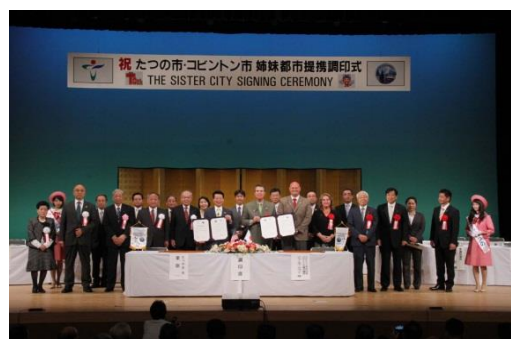
調印後、関係者で記念撮影