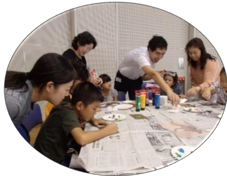
《国際交流員の過去の活動》