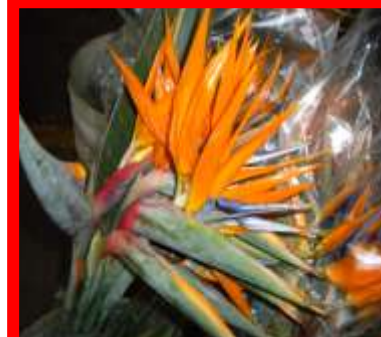
AVE DEL PARAÍSO Ave del paraíso