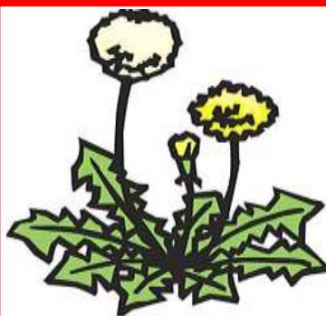
DIENTE DE LEÓN diente de león