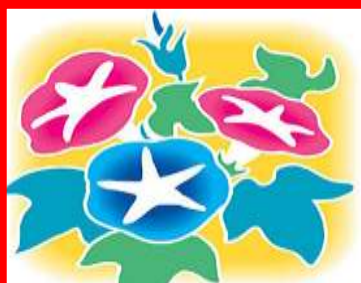
BUENOS DÍAS buenos días