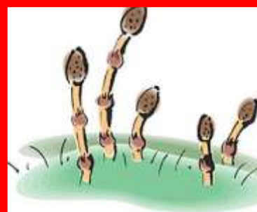
COLA DE CABALLO cola de caballo