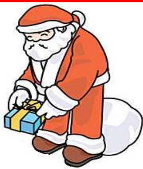
PAPÁ NOEL Papá Noel