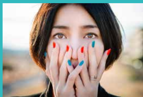
フォトグラファー

講演会終了後、JICA 関西に場所を移して書籍購入者限定でサイン会を実施します。販売数に限りがありますので、先着順とさせていただきます。 場所: JICA 関西 2 階 ブリーフィング室