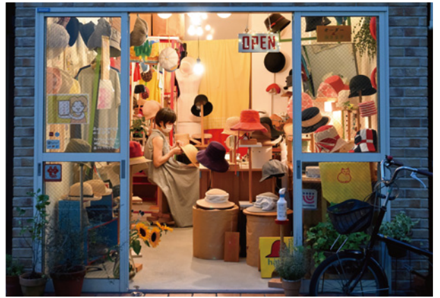
Grand Prize : Morten Helland / Norway