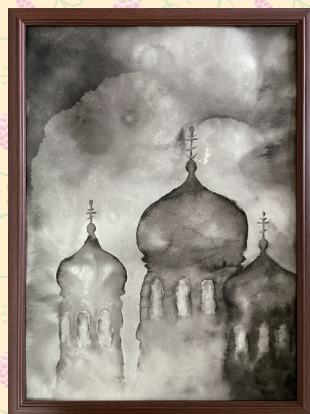
水墨画：遊霞「預言」。モルドバ人の多くが信仰するロシア正教の教会。