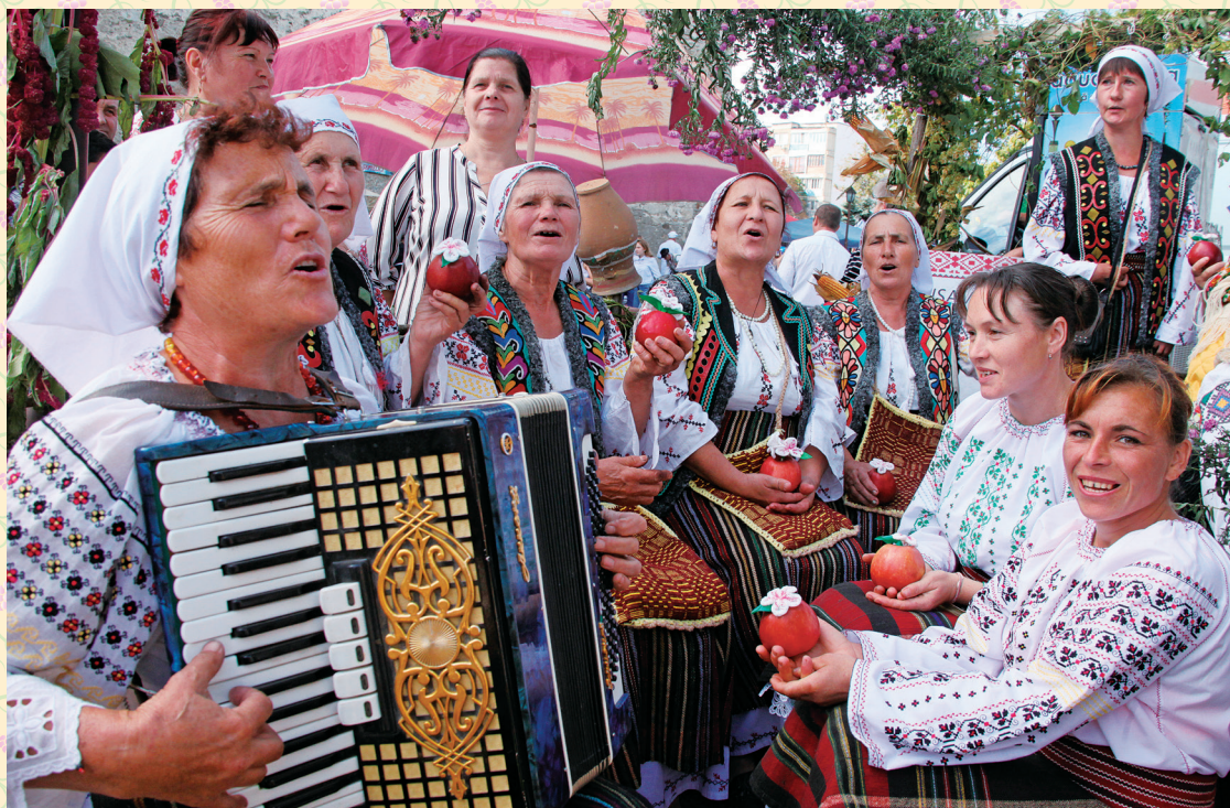
@みやこうせい。ラテン民族のモルドバ人の生活には歌やダンスが溢れています。