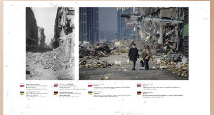
「ワルシャワとマリウポリ」展示パネルの1枚

ロシアの侵攻によるウクライナでの戦争は、甚大な被害をもたらしています。平和が戻った後のウクライナの復興を願い、破壊されたウクライナのマリウポリと第二次世界大戦時のポーランドのワルシャワを比較する写真（2022年ポーランドで制作。2023年2月駐日ポーランド共和国大使館、6月京都で展示。）と、抵抗し廃墟となったワルシャワの街の戦後復興を振り返る展示を行います。セミナーでは、侵攻後のウクライナの現状と戦争終結後の課題を考え、復興への希望を展望します。