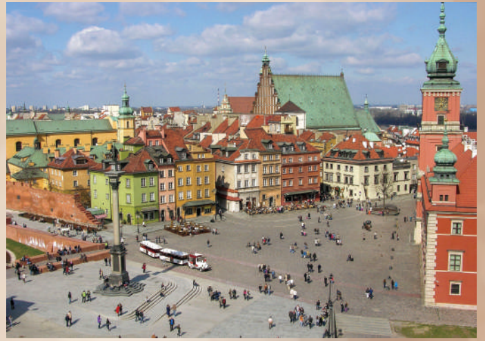
現在のワルシャワ旧市街