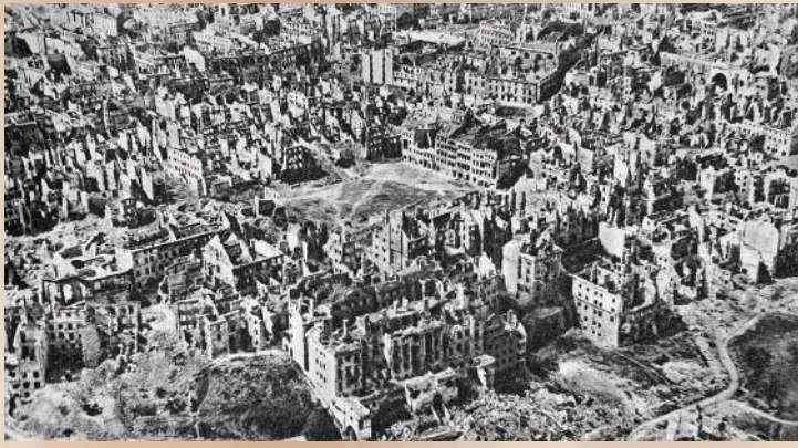
破壊されたワルシャワ（旧市街一帯）