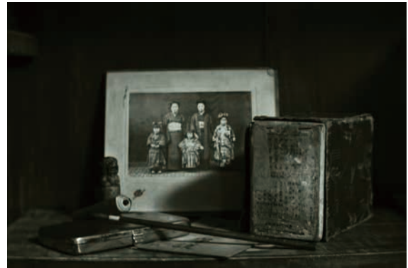
Grand Prize: Nicolo Tassoni Estense / Italy

The exhibition celebrates its 23rd anniversary this year with the theme of “at Home in Japan.” Having to inevitably stay at home in a world with COVID-19, in order to think positively about being “at Home” (indoors), 56 diplomats from 40 countries took pictures of the scenery from the window of their room, moments of their lives, etc.