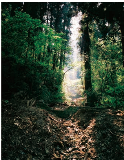
Aleksandr Filich / Belarus