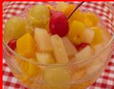
ENSALADA DE FRUTAS ensalada de frutas