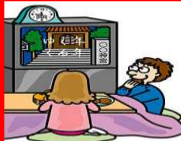
SALA DE ESTAR sala de estar