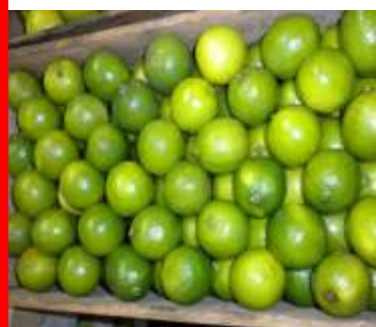
LIMÓN VERDE limón verde