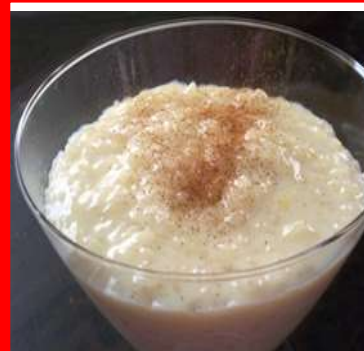
ARROZ CON LECHE arroz con leche