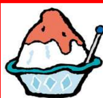
HIELO RASPADO helo raspado