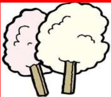
DULCE DE ALGODÓN dulce de algodón