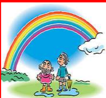
ARCO IRIS arco iris