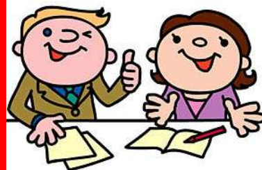
PROFESOR PARTICULAR profesor particular