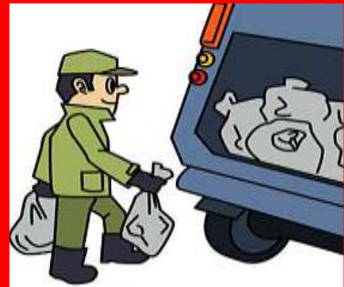
EL BASURERO El basurero