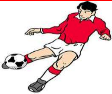
JUGADOR DE FÚTBOL jogador de fútbol