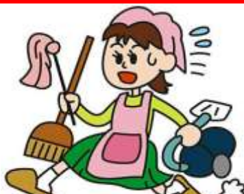
AMA DE CASA ama de casa