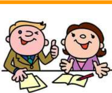
PROFESSOR PARTICULAR professor particular