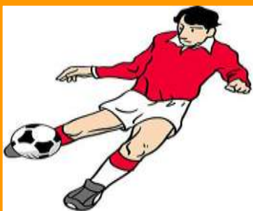
JOGADOR DE FUTEBOL jogador de futebol