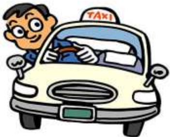
MOTORISTA DE TÁXI motorista de táxi