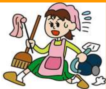
DONA DE CASA dona de casa