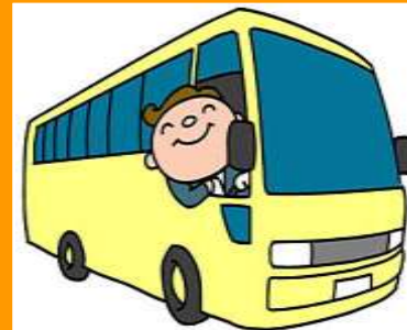
MOTORISTA DE ÔNIBUS motorista de ônibus