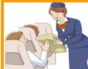
COMISSÁRIA DE BORDO comissária de bordo