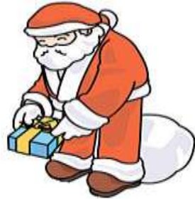
PAPAI NOEL Papai Noel