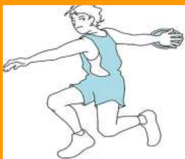
ARREMESSO DE DISCO arremesso de disco