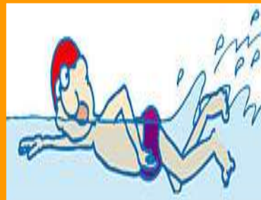
NADO CRAWL nado crawl