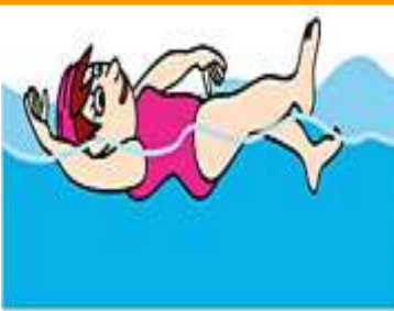
NADO DE COSTAS nado de costas