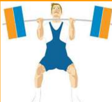
LEVANTAMENTO DE PESO levantamento de peso