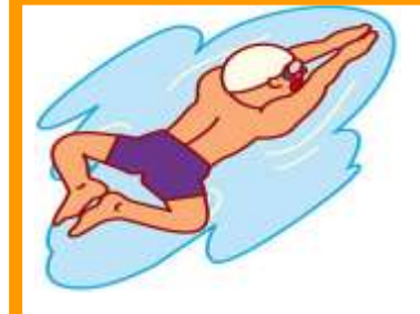
NADO DE PEITO nado de peito