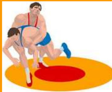
LUTA LIVRE luta livre