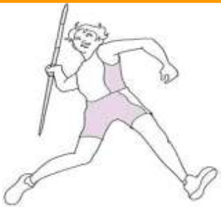
LANÇAMENTO DE DARDO lançamento de dardo