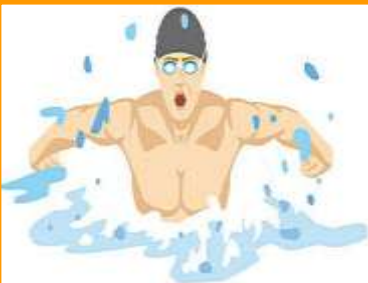
NADO BORBOLETA nado borboleta