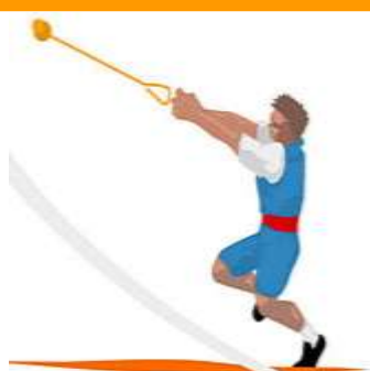
ARREMESSO DE MARTELO arremesso de martelo