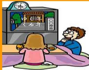
SALA DE ESTAR sala de estar