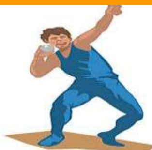
ARREMESSO DE PESO arremesso de peso